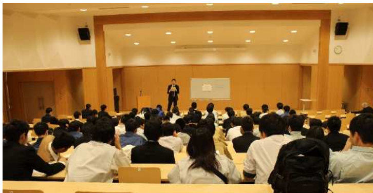
昨年度(平成29年11月)の講習会の様子。実技講習(左)学科講習(右)