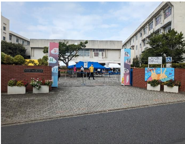
アーチ(正門の様子)