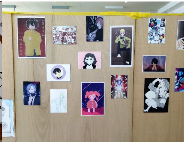
イラスト・デザイン 部