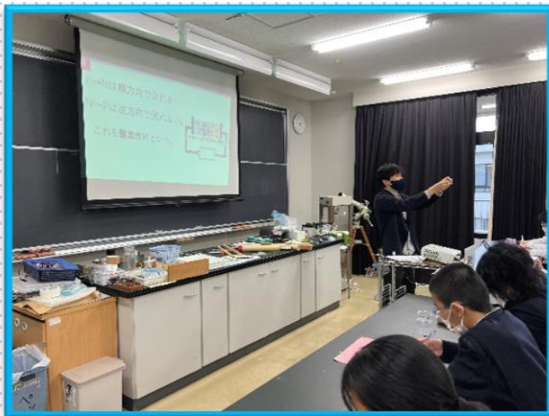
Odatech (SSHに関する特別な講座)