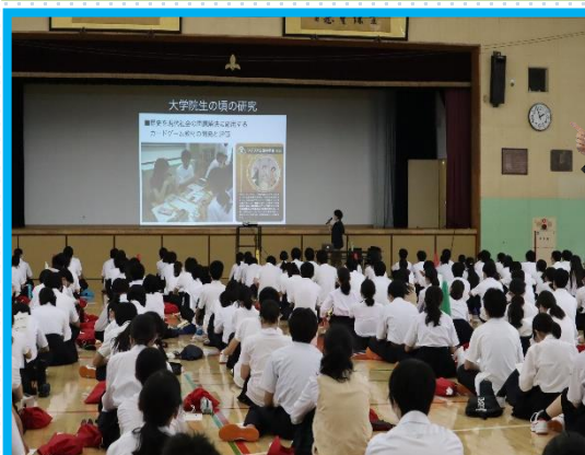
「理数探究」に関する講演