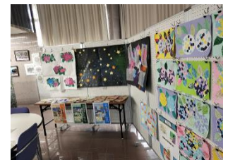
↑昨年度の作品展より

※なお、中学部の生徒作品は、10月中旬に三の丸ホール展示室にて開催される「小田原・足柄下地区中学校生徒美術展」に参加、出品します。