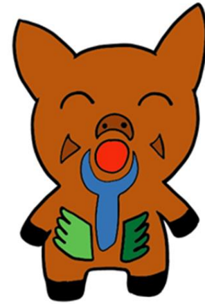
ゆがわらこうしゃ ゆるキャラ ユノッシー