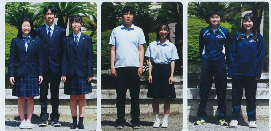
※令和3年度より、夏服として学校指定ポロシャツを制定しました。