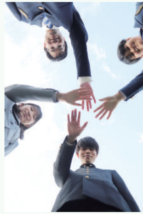
大井高校と小田原城北工業高校の生徒

学科併置の強みをいかした教育課程を編成し、生徒一人ひとりの興味・関心や多様な進路希望に応じた幅広い教育活動を展開します。