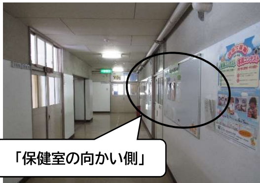
「保健室の向かい側」