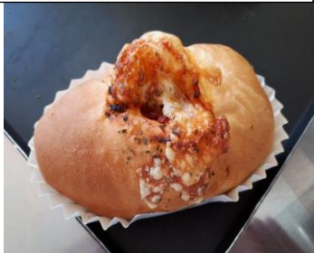
カレーウィンナー 100円