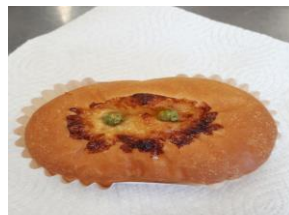
シューマイパン 100円