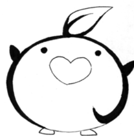
相模向陽館 こうちゃん

「学力に不安を感じている」「やる気があるのになかなか勉強についていけない」「小学校・中学校時代に不登校を経験したことがある」などの経験がある皆さんも安心して学ぶことができます。各授業担当者は授業において、わかりやすく説明します。また、それでも理解できない時には、トライアルタイムを利用して先生と学ぶこともできます。