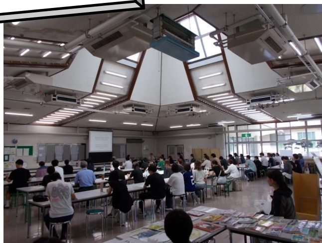
夏季公開講座の様子