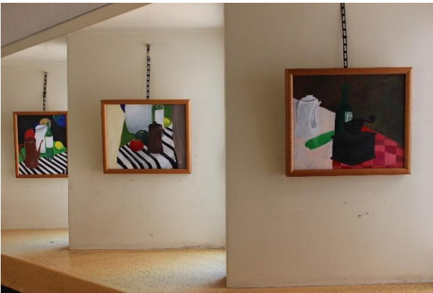
新2年生が制作した静物画（F8サイズ）

4月10日（金）、1・2年生美術の授業で制作した作品の展示替えをしました。2年生の風景画があった場所には1年生の静物画を、美術室前の廊下には2年生の新作を展示しました。また社会科教室前のショーケースには2年生が作った『バターナイフ、はし、はし置き』を展示します。在校生の皆さん、次に登校する時にぜひ鑑賞してみてください。