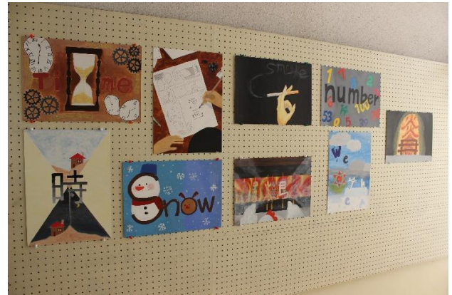
単語を使ったデザイン