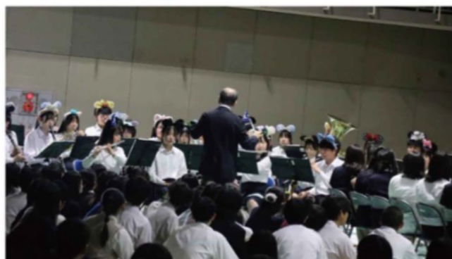
韓国姉妹校来校 歓迎会