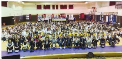
海外研修旅行 台湾訪問 台北市立松山高級工農職業学校にて