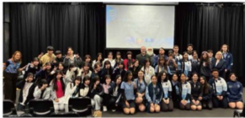
海外研修 オーストラリア訪問 Mabel Park State High Schoolにて