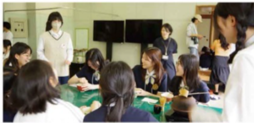
韓国 姉妹校交流 水原(スウォン)外国語高校来校 授業風景