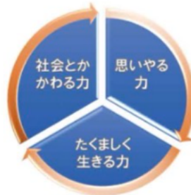
かながわ教育ビジョン