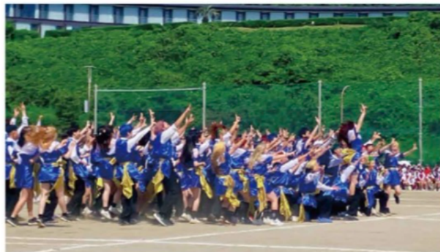
七里ンピック (体育祭)