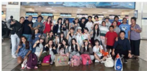
海外研修 グラム訪問 Saint Paul Christian Schoolにて