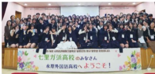
韓国 姉妹校交流 水原(スウォン)外国語高校にて