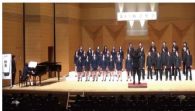
合唱祭 鎌倉芸術館にて