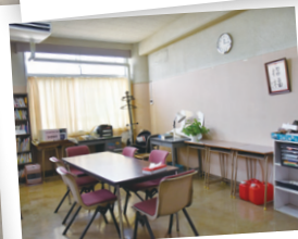
カウンセリングルーム