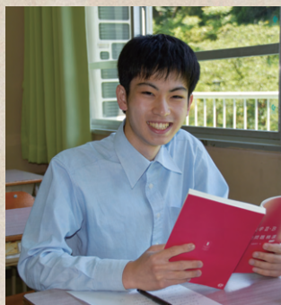
40期卒業生 東京工科大学進学