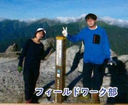
フィールドワーク部