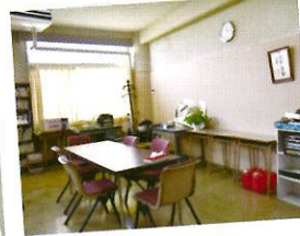
カウンセリングルーム