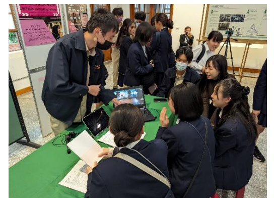
新竹の生徒との質疑