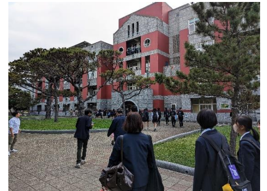
新竹高級中学に到着