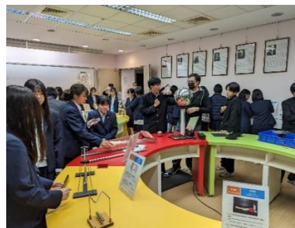
大学内の体験実験施設