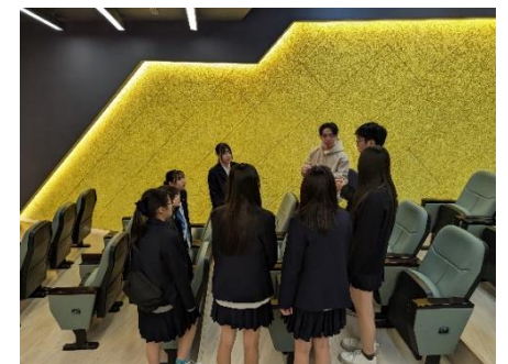
大学院生とのセッション