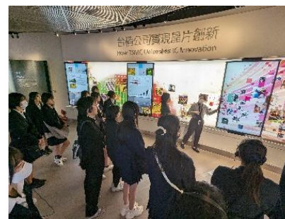
TSMC 担当者からの説明を聞く 生徒たち