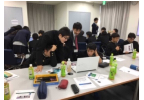
ミラバイオロジクス株式会社