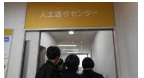
総合高津中央病院