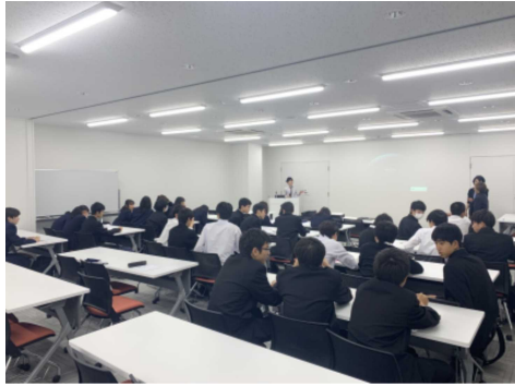
LIC(ライフイノベーションセンター)