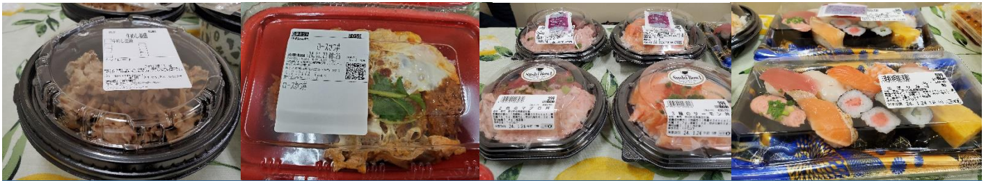
定番の牛丼・ロースかつ丼（レンジでチンするよ）とマグロやサーモンの海鮮丼とお寿司セット