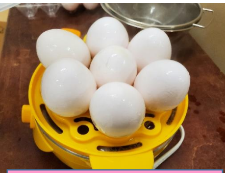
ゆで卵マシンで作った人気のゆで卵ちゃん！ほんのり温かくて美味しいよ