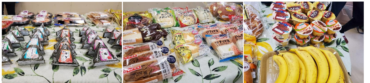
各種の具材が入ったおにぎり、総菜パンや菓子パンコーナーそして各種デザートと果物たち