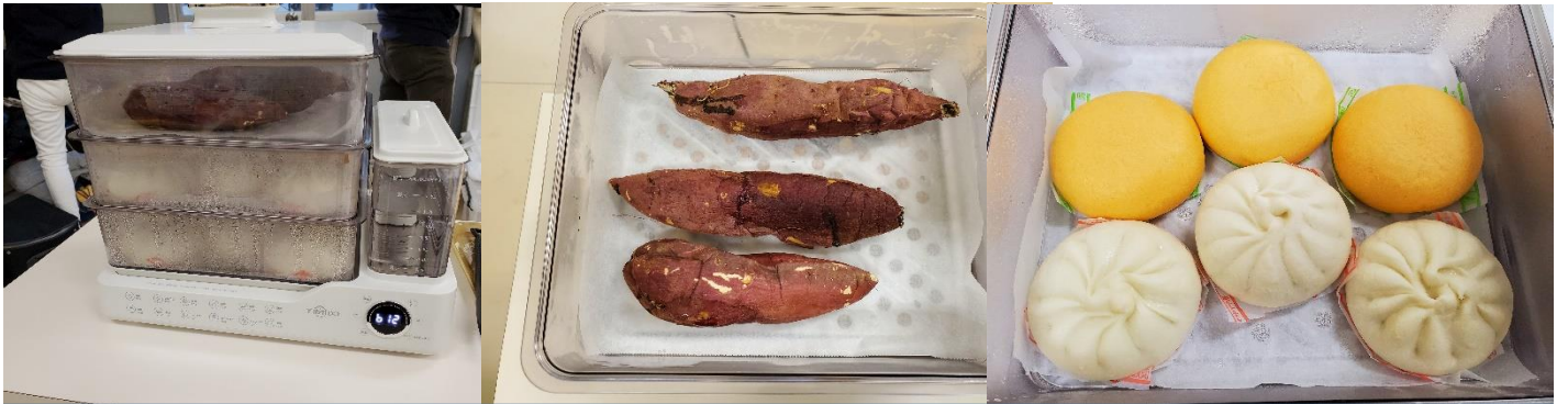
新規購入した必殺「三段蒸し器」！今日は焼き芋と肉まん・ピザまんを温かくしています。