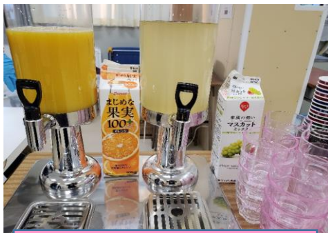
ドリンクバーは日替わりメニューです。この他に、ホットメニューもあるよ！