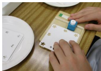
↑ファンファンより