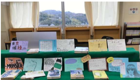
【図書委員会 POP 展示】