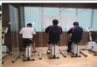
宿泊学習(県立スポーツセンター)