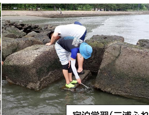
宿泊学習(三浦ふれあいの村)