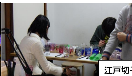
江戸切子づくり(浅草)