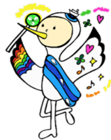
鶴見養護学校キャラクター