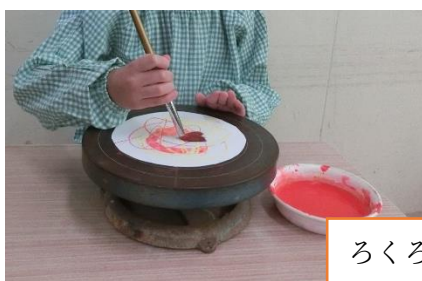
ろくろでぐるぐる