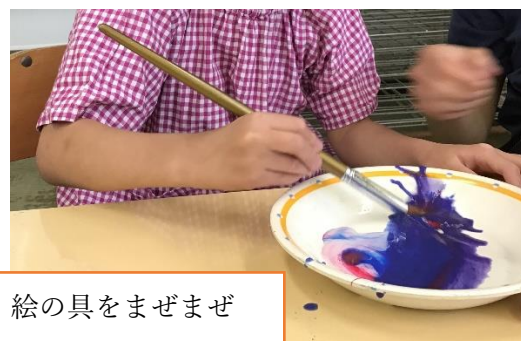
絵の具をまぜまぜ