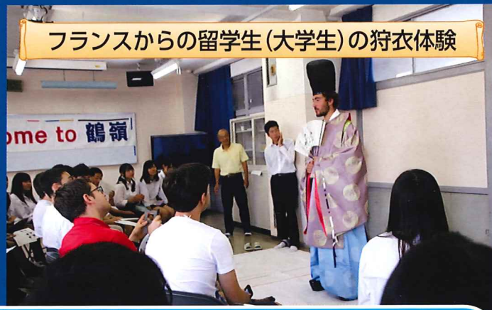
フランスからの留学生(大学生)の狩衣体験