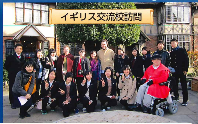
イギリス交流校訪問