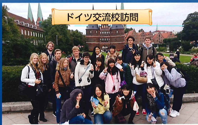
ドイツ交流校訪問