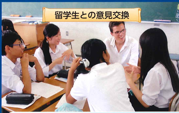
留学生との意見交換

イギリス・ドイツ・ニュージーランドの交流校を訪問し、現地校生徒と交流します。また、ホームステイなどの経験もします。※訪問先は状況により変わることもあります。