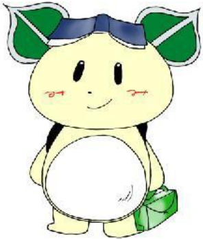
創立 90 周年 オリジナルキャラクター 「みどなりくん」 (生徒デザイン)

役員会、理事会、総会、卒業式・入学式への出席、三徳会一般会計・特別会計の監査、などが主な活動です。活動は平日です。