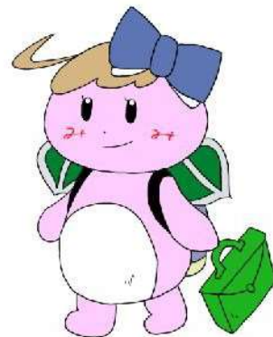
同女の子キャラクター 「みどりんちゃん」