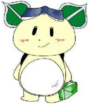
創立 90 周年 オリジナルキャラクター 「みどなりくん」 (生徒デザイン)

役員会、理事会、総会、卒業式・入学式への出席、三徳会一般会計・特別会計の監査、緑高祭での本部ブースの運営、などが主な活動です。活動は平日です。