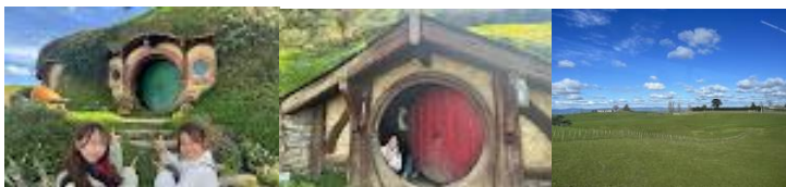
中日 オークランド郊外への Day Trips ワイトモ洞窟と、マタマタのホビトン村訪問 ニュージーランドらしい風景と、大自然を満喫