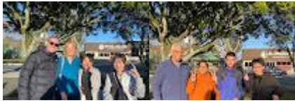
ホストファミリーとのご対面！