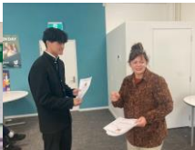
8月11日（月）～22日（金） Mount Roskill Grammar School の授業に参加