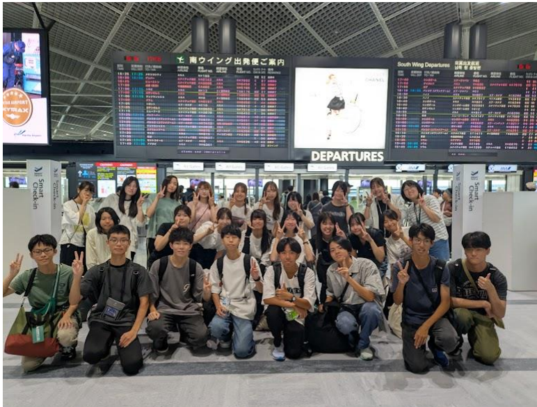
8月8日（金）夜 成田空港から出発

初めは、初の海外渡航に不安に感じていた生徒もいましたが、帰国する頃にはすっかり自信が付き、新たな成長へとつながった様子です。