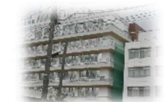
昭和大学藤が丘病院

「藤が丘学級」は、田園都市線の藤が丘駅から徒歩 5 分の「昭和大学藤が丘病院」の中にあります。大人も入院している病院です。子どもたちは 4 階の「子どもセンター」という病棟に入院していて、学習室はこの病棟内にあります。小学部と中学部の児童・生徒が在籍していて、授業は学習室やベッドサイドで行います。学習室では国語や算数を始め、音楽で歌を歌ったり、体育では「ごろ卓球」などもしたりします。ベッドサイドの学習でも、iPad を使った学習をしたり、「かごにいれましょ」というボール運動で、体育の授業を楽しんだりしています。「何の授業が好き？」の問いには、多くの子どもたちが「体育！」と答えるほど、体を動かすことが皆大好きです。