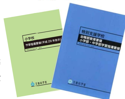
小学校と特別支援学校の学習指導要領

日本のどこに行っても、全国のどの地域で教育を受けても、一定の水準の教育を受けられるようにするため、学校教育法等に基づき、各学校で教育課程（カリキュラム）を編成する際の基準を文部科学省が定めたもの、それが「 学習指導要領 」です。