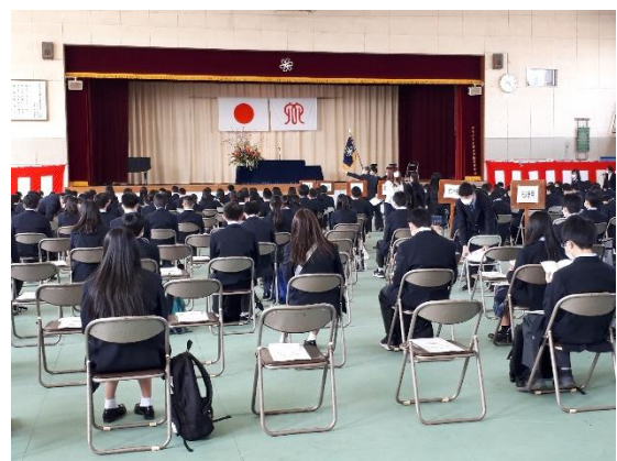
*ソーシャルディスタンスを取った入学式

4月7日、横浜清陵高等学校の第4期生の入学式が行われました。緊急事態宣言のなか、初めての入学式であり、新入生も合格者説明会以来の登校であり、その後、1年次生は教科書販売と個別登校でしか登校する機会がなく、ほとんどの生徒が学校再開まで2～3回