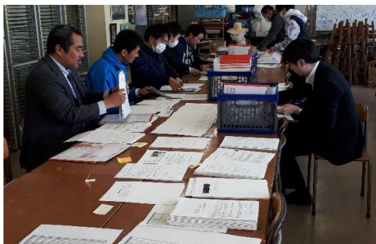
*課題を整える教員

スマートフォンにアカウントを入れ、スマートサプリが上級生と同じように使用できるようにしました。これにより本校の全生徒は家庭でスタディサプリを用いて動画の授業を見ることが可能になりました。