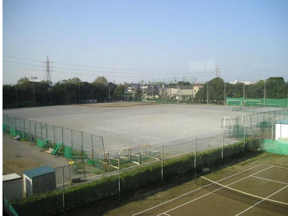
誰もいない第2グラウンド

6月1日に本校も学校が再開され、1年次生が登校しました。翌日より2年次生、3年次生が登校してきました。この間、3月2日より約3ヶ月に渡って休校となっていました。5月7日に政府より、本県に対して緊急事態宣言が延長されました。しかし、校長は教職員に対して6月の再開に向けて、これからの3週間は再開準備期間と位置づけ、準備してきました。