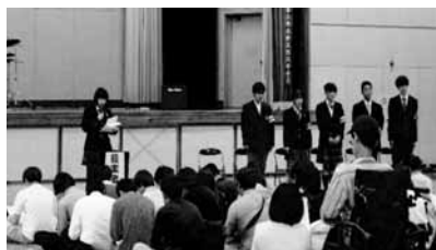
【新役員体制を紹介する生徒会長】

生徒総会終了後、引き続き「部・同好会・委員会説明会」が行われました。それぞれの団体がパンフレットや発表に工夫を凝らし、久しぶりに復活した弓道部の試技や音楽関係の実演もあり、楽しい会になりました。