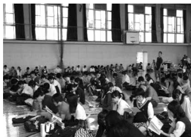
【上：昨年の生徒総会の様子】

また、生徒総会の日程は、新型コロナウイルス感染拡大防止対策に伴う学校臨時休業のため延期になっています。日程は決まり次第、連絡します。