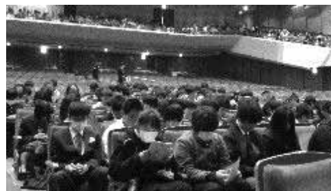
【昨年度の入学式の様子】