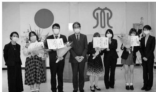
【卒業生のみなさんと担任】

「校長のことば」では、さまざまな苦難を乗り越え通信制での学びをやりとげた卒業生に対し、この学校で彼らが身に付けた力について話がありました。それは、①頑張りすぎずに頑張る力 ②相談できる力 ③自分の弱みは人の助けを借り、自分の強みを生かし社会に繋がる力の3つです。これらの力を忘れずに、新しい一歩を踏み出してほしい、そしてこれからの時代を生きていくうえで、自分に何ができるかを考えて行動してください。と卒業生にエールが送られました。