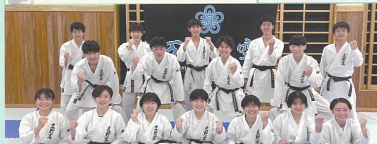
空手道部 日々努力！目指せ県優勝！いざ関東、そして全国へ！