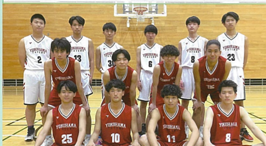
バスケットボール部（男子） 県大会出場を目標に日々頑張っています。