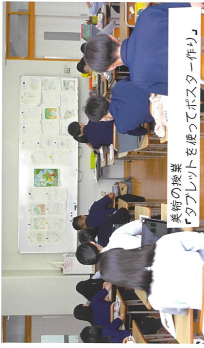
美術の授業 「タブレットを使ってポスター作り」