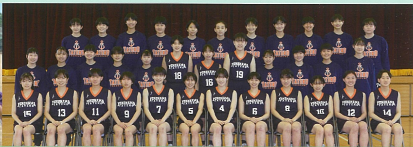
バスケットボール部（女子） 待ってる関東！行くぞ全国！目指せ県優勝！ 2023 インターハイ出場決定！