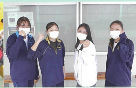
水泳部 “プールはないけど、熱意はある！”がキャッチフレーズです。緑ヶ丘高校の水泳部と合同で和気あいあいと活動しています。