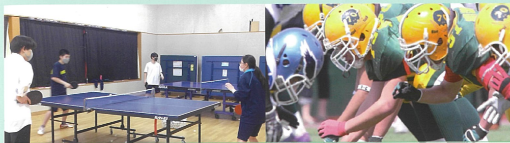
卓球部 地区大会を突破し、県大会出場を目指して、がんばっています。