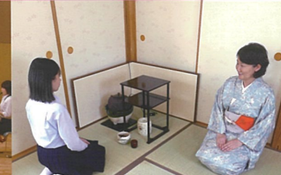
茶道部 週に2回講師の先生にご指導いただき活動しています。