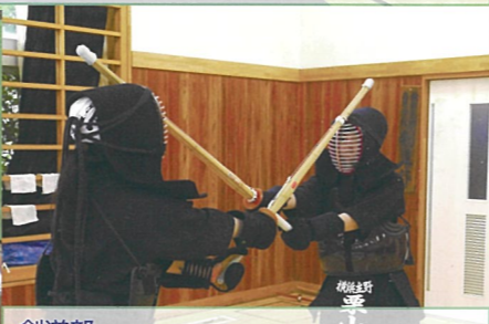
剣道部 顧問の先生に御指導いただきながら日々練習を積み重ねています。