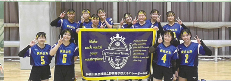
バレーボール部（女子） 4大会連続、神奈川県ベスト16 もう一つ上へ