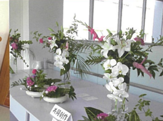
華道部 月に2回活動しています。