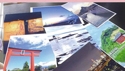
写真部 週一回楽しく活動しています。