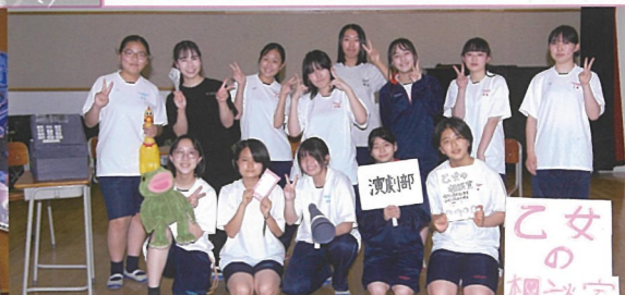
演劇部 大会、発表に向けて頑張っています。