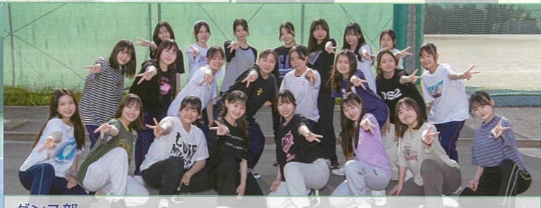
ダンス部 文化祭発表や大会出場など1つでも多くの舞台上に立てるよう日々スキルアップに励んでいます。