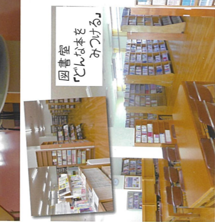
図書室 「どんな本を みつける」

*平成28年度より、ポロシャツの導入 *令和3年度より白色ポロシャツの導入 *学校指定・希望者のみの着用