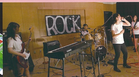
軽音楽部 発表会に向けて日々練習しています。