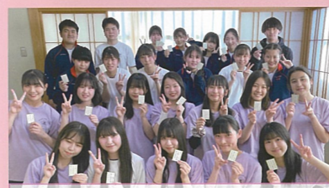
競技かるた部 大会で良い成績を残せるよう個人、団体ともに練習に励んでいます。