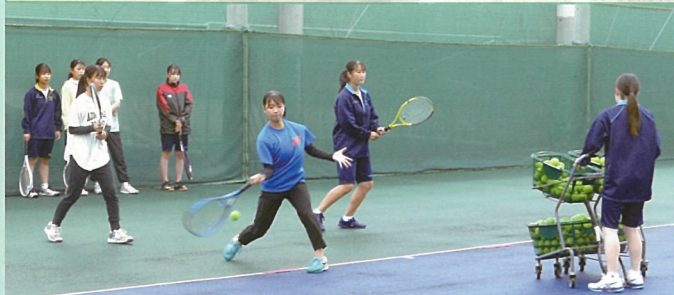
テニス部 県16・市8を目指して日々努力を重ねています。