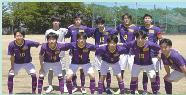
サッカー部 大会を目指して日々練習に励んでいます。