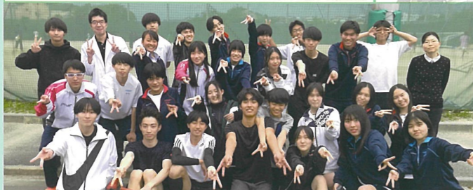
陸上競技部 陸上部は部員36名で活動しています。5月のインターハイ予選、7.10月の県大会予選突破を目標に頑張っています！