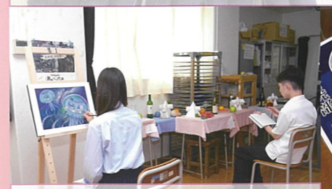
美術部 高校美術展に出品しています。昨年度は2点入選しました。