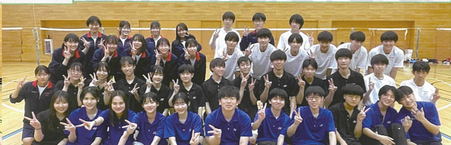
バドミントン部 県大会に向けて日々練習に取り組んでいます。