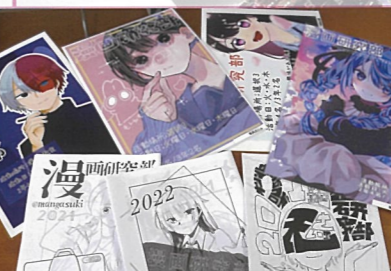
漫画研究部 楽しく絵を描き元気に活動しています。