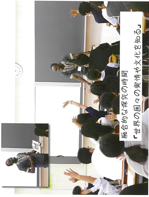
総合的な探究の時間 「世界の国々の実情や文化を知る」