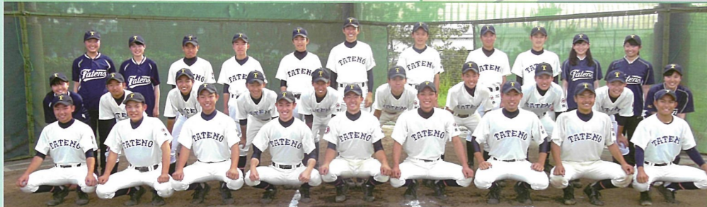
野球部 勝利を目指して、日々努力しています。