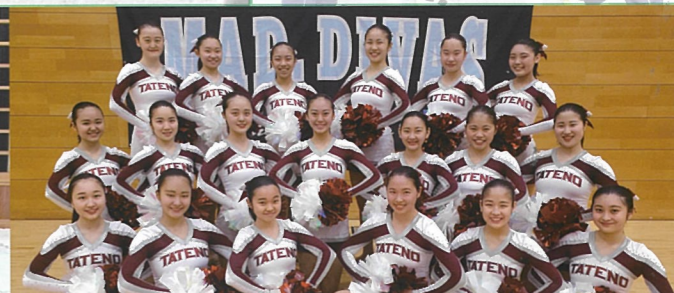
ソングリーダー部 全国大会入賞を目指しています。