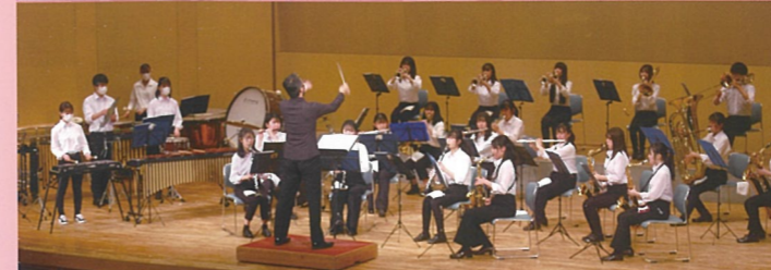
吹奏楽部 文化祭、コンクール、定期演奏会で頑張っています。