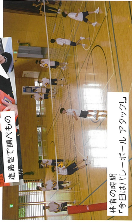
体育の時間 「今日はバレーボールアタック!」