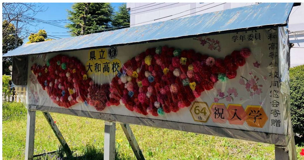
《学年委員会が歓迎の思いを込めて制作したウェルカムボード》

新入生の皆さまが、大和高校で多くのことを学び、仲間とともに充実した高校生活を送られることを心より願っています。