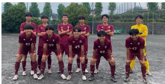
(川和高校 C チームとの試合に臨む大和高校 B チーム)