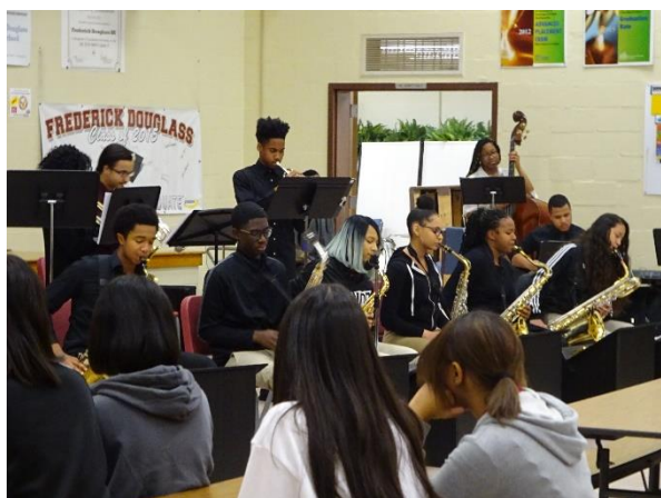
パワフルなジャズバンドの演奏

その後、2～4時間目はバディと一緒に授業に出席しました。5時間目にはPep Rallyという部活動奨励会が行われました。