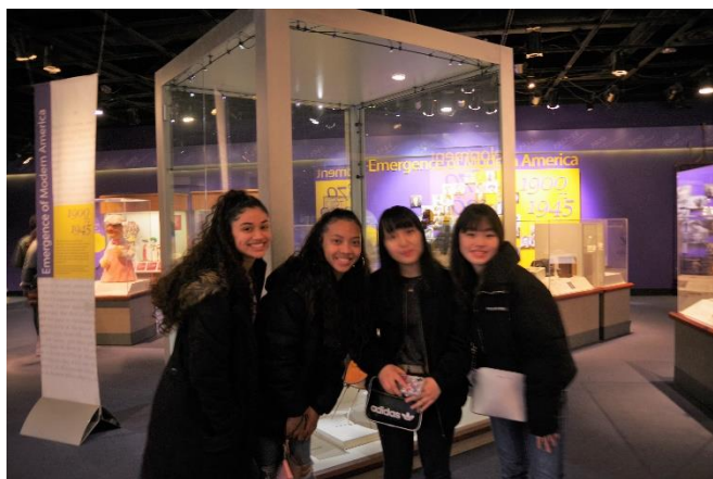
アメリカ史博物館にて