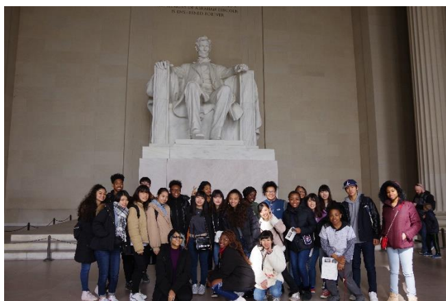
リンカーン像の前で

国立アメリカ歴史博物館ではアメリカの歴史や大統領について学び、ユニオン駅のフードコートで昼食をとった後、フレデリック・ダグラス・ハウスに行きました。フレデリック・ダグラスはアフリカ系アメリカ人の政治家で、リンカーン時代の奴隷廃止運動の指導者でした。知識が豊富なガイドさんが、姉妹校の名前にもなっている偉人について詳しく説明してくださいました。