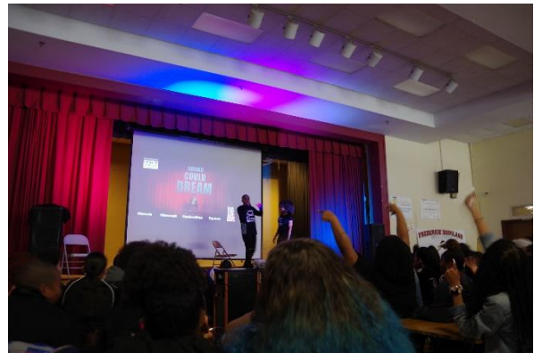
ライブのような講演会