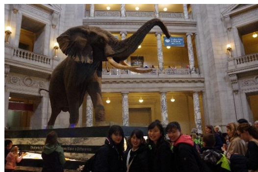
世界最大のゾウのはく製