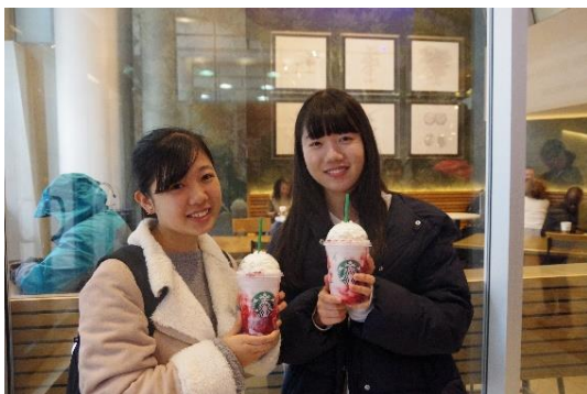
日本にはないフレーバー