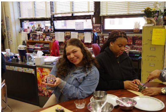
お花のお寿司、できた♡