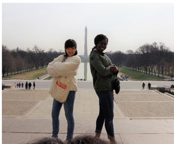
キング牧師の演説スポット