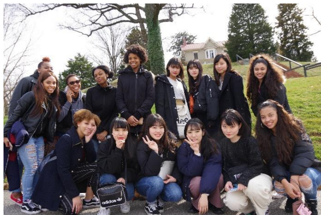
フレデリック・ダグラスの家の前で