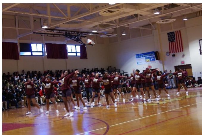
ダイナミックなダンス