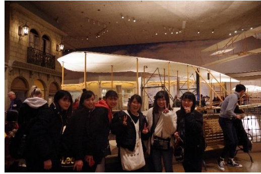
ライト兄弟の飛行機