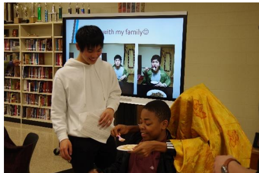
日本のスナックを二人羽織でどうぞ