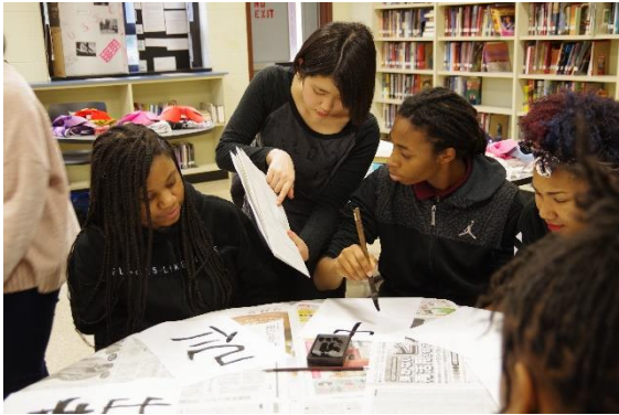
書道を体験してもらったり…