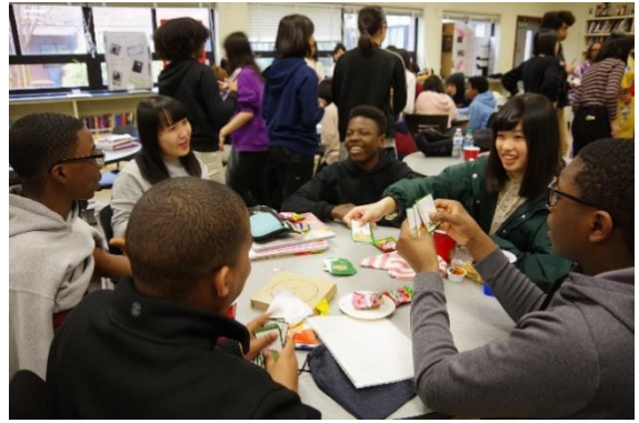
坊主めくりをしたり…