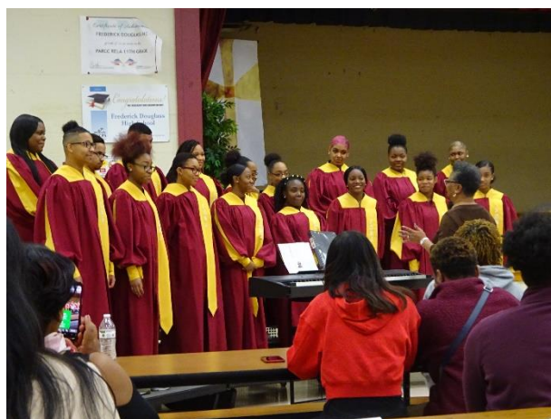
美しいハーモニー