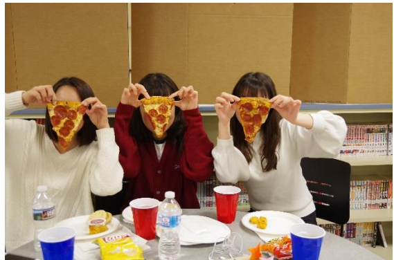
アメリカのピザは大きい！