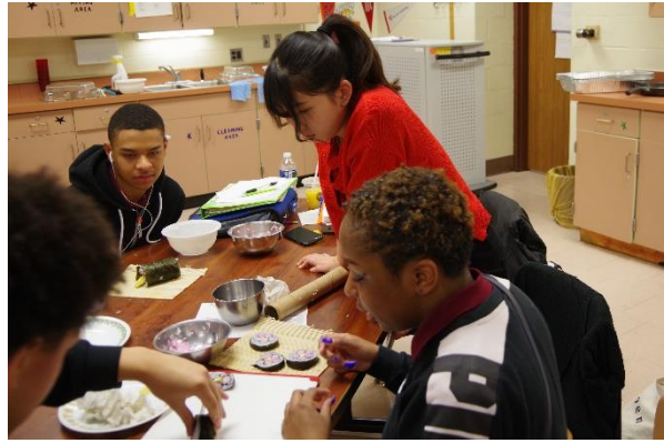
お寿司作りのお手伝い