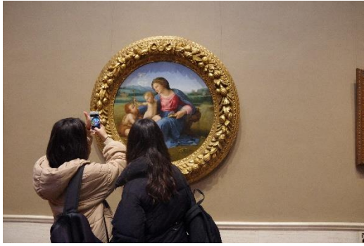
ラファエロの絵に感動