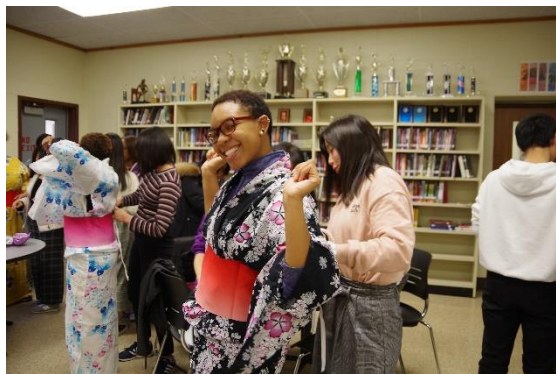
浴衣を着てうれしそう♡