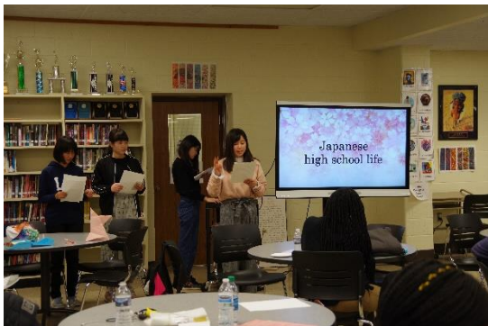
日本の学校生活を紹介

午前中に授業を受けた後、3か月間準備をしてきたプレゼンテーションを行いました。4つのグループが自分たちでテーマを決めて、日本文化を紹介するのです。緊張しましたが、アメリカの生徒さんたちはリアクションが大きく、また楽しそうに活動にも参加してくれたので、大きな達成感を得ることが出来ました。