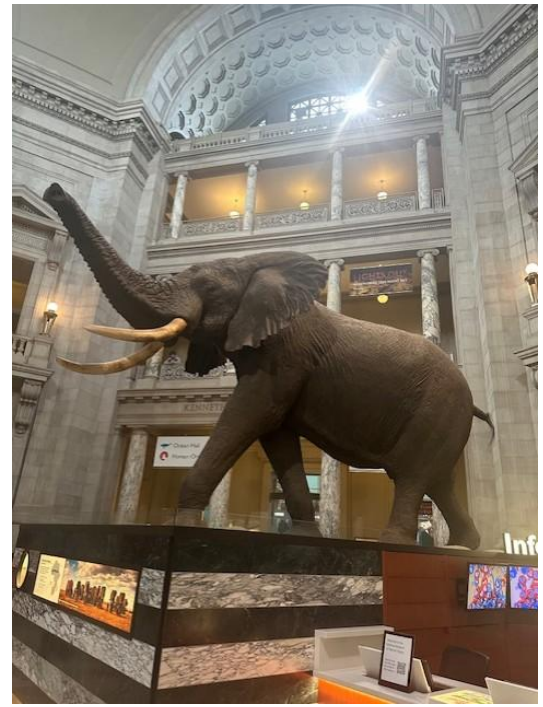
世界最大級のゾウのはく製