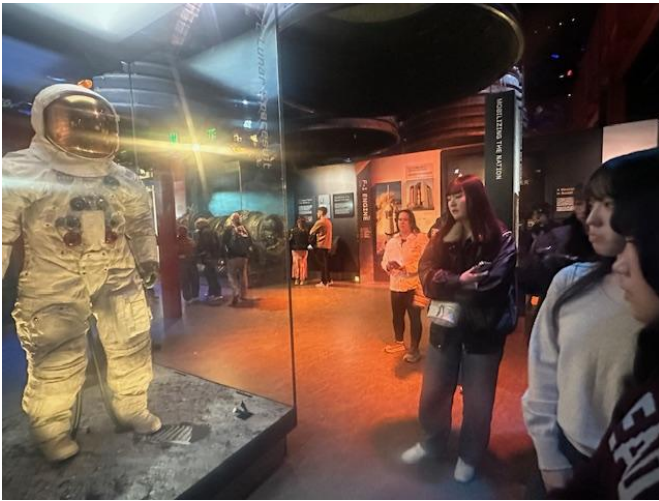
実際に着用した月面着陸宇宙服