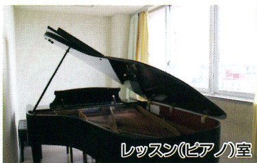
レッスン(ピアノ)室

充実した教育のための環境づくりを目指しています。校舎棟 7階建て全教室冷暖房完備、体育館棟には、体育館や武道場、弓道場、小ホールなどを備え、様々な活動に対応しています。