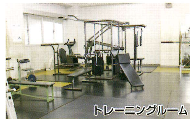
トレーニングルーム