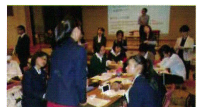
エントリー校としての取り組み