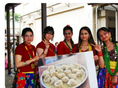
多文化共生研究会