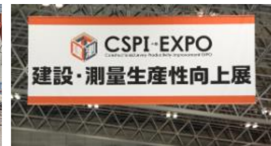
建設・測量生産性向上展