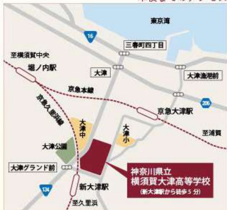
本校までのアクセス