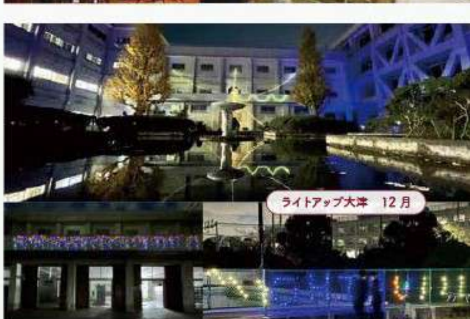
ライトアップ大津 12月

後期中間試験②（1・2年） 学年末試験（3年） 2年進路スタートアップ講演会 ライトアップ大津