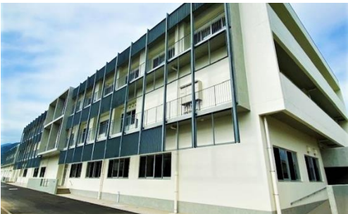
最新の設備を備えた第6実験実習棟