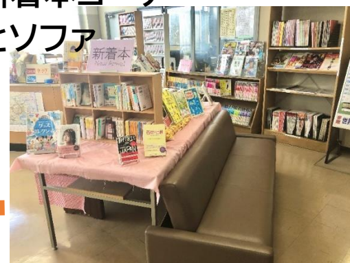
新着本コーナー とソファ