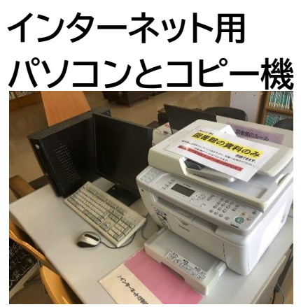
インターネット用 パソコンとコピー機