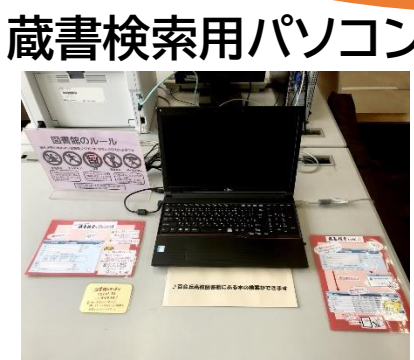
蔵書検索用パソコン