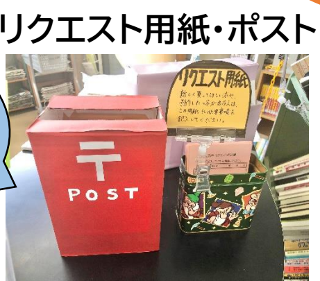
リクエスト用紙・ポスト