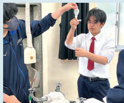
（理数探究の授業風景）

本校では、理数科学教育を推進しています。希望者は「理数探究」「理数探究基礎」を選択し、通常の理科や数学の授業では学習できない高度な内容を、講義や実験・観察などを通じて学ぶことができます。